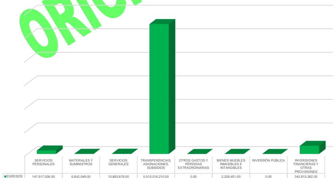
Gráfico 2. Egresos